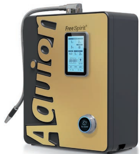
Neues Kapitel einer Erfolgsstory: Der Aquion FreeSpirit

Jetzt kann unser wichtigstes Lebensmittel, das Trinkwasser, gezielt moduliert werden – je nach Bedürfnis und persönlicher Lebenssituation. Dies macht das